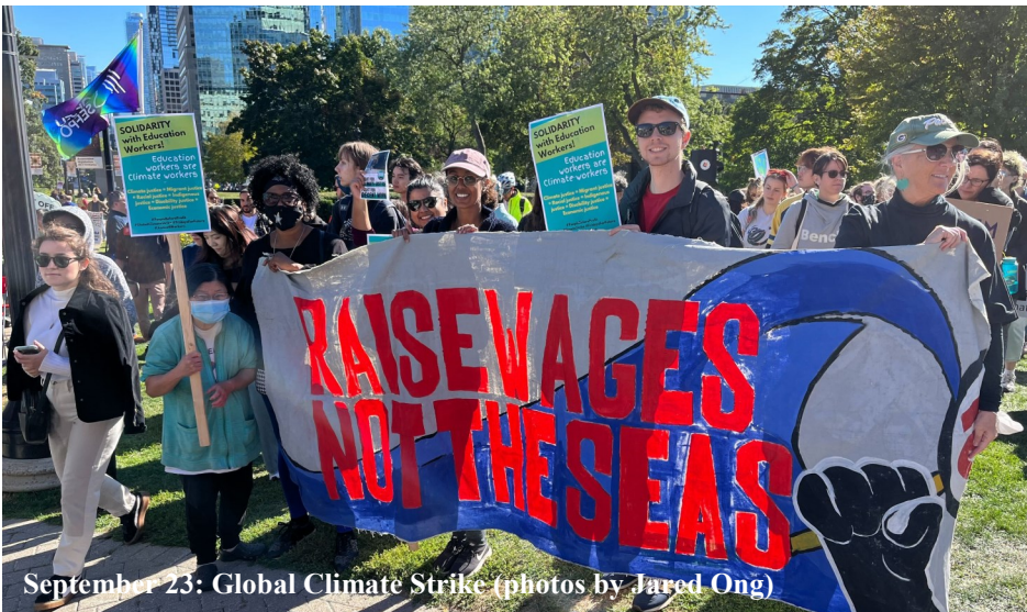
September 23: Global Climate Strike

Justice for Workers was at the Global Climate Strike in Toronto on Friday, September 23. This planet is suffering from misuse on a grand scale as global capitalism plows over people and natural resources in favour of corporate greed for more and more profit. Excessive pollution and irreparable damage to nature has continued unchecked. Unsustainable ecological practices like over-hunting and fishing, logging, mining, and dumping toxic waste where BIPOC and poorer communities live, and more are all sanctioned by our government.