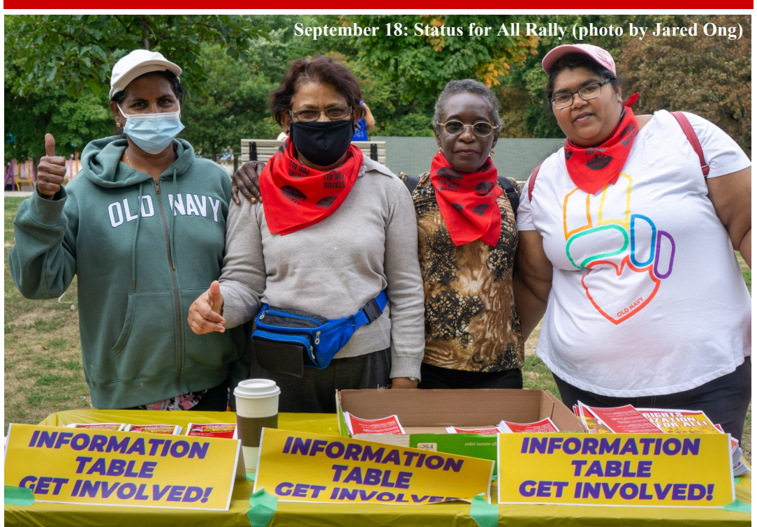
September 18: Status for All Rally

If you need help applying for Employment Insurance, please call the Workers Action Center at (416) 531-0778.