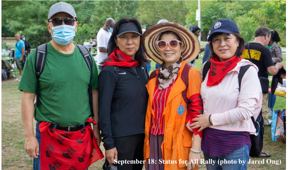
September 18: Status for All Rally

强力的演讲，令我们群情振奋，占领了 Bloor街，前往国会议员 MP Freeland 的