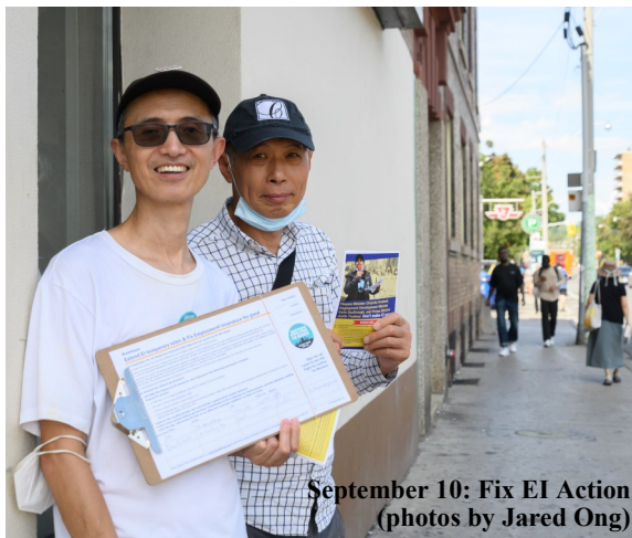
September 10: Fix EI Action