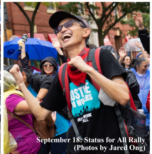
September 18: Status for All Rally

Another great month of organizing! To show for it, we've reached more people who are passionate about our top issues and eager to join the movement.