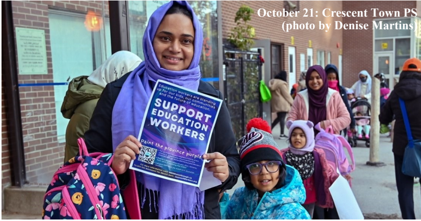
October 21: Crescent Town PS