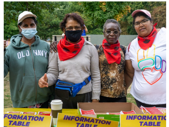
Above: About 300 WAC members and their families attended the Status for All Rally on September 18