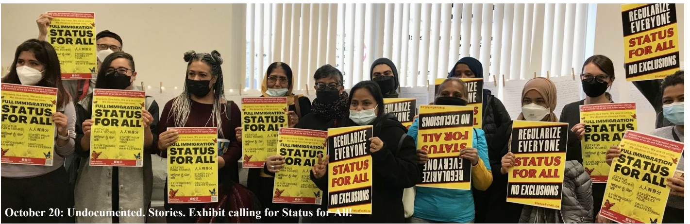
October 20: Undocumented. Stories. Exhibit calling for Status for All!

সকলের জন্য সমান অভিবাসী মর্যাদার দাবিতে ওয়ার্কাস অ্যাকশন সেন্টারের সদস্যরা গত ১৬ ই অক্টোবর বৃহত্তর টরন্টো এলাকায় ক্যাবিনেট মন্ত্রীদের অফিসে পোস্টারিংয়ের মাধ্যমে একটি কার্যকরী পদক্ষেপ নিয়েছিল। পুরো কানাডা জুড়ে, মন্ত্রিসভার ৩৯ জন সদস্যের মধ্যে ৩২ টি অফিসে উক্ত কার্যক্রম হয়েছিল! এমপি ক্রিস্টিয়া ফ্রিল্যান্ডের অফিসে, একটি শক্তিশালী বড় জমায়েত হয়েছিল এবং বিভিন্ন সংবাদ মাধ্যমগুলো আমাদের সংবাদটি প্রকাশ করেছিল। এই পদক্ষেপগুলি প্রধানমন্ত্রী ট্রুডোকে খুব শক্তভাবে স্মরণ করিয়ে দিয়েছিল যা গত ১০ মাস আগে অনির্দিষ্ট শ্রমিকদের নিয়মিত করার এবং পারমিটসহ শ্রমিক ও শিক্ষার্থীদের স্থায়ী মর্যাদা দেওয়ার প্রতিশ্রুতি দিয়েছিল।