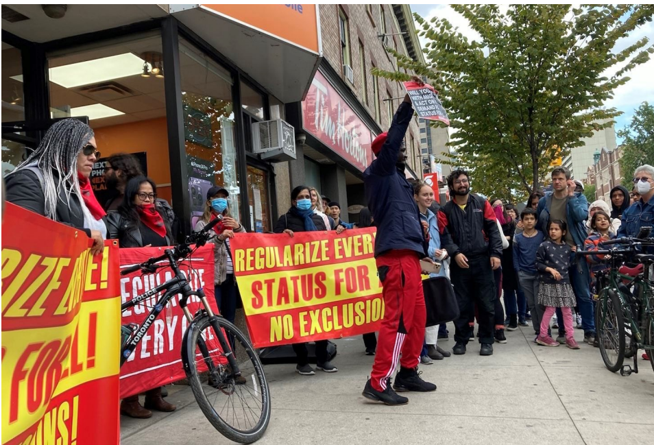
October 16: Status for All action at MP Chrystia Freeland's office

El proyecto de ley 4, "Stay Home If You Are Sick Act" ("Quédate en casa si estás enfermxx"), presentado por el NDP, se debatirá el 24 de noviembre y se votará poco después. El gobierno de Ford se ha negado a legislar 10 días de enfermedad pagados más de 25 veces - ¡pero ya les hemos obligado a cambiar de rumbo! Hablaremos con lxs miembrxs de la comunidad sobre el proyecto de ley 4 el jueves 10 de noviembre de 8 a 9 de la mañana en varias estaciones de metro. ¡Por favor, inscribise o haga su propio plan para correr la voz!