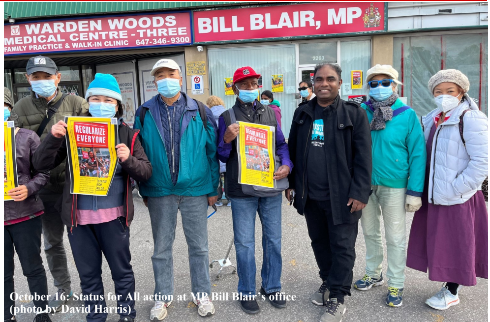
October 16: Status for All action at MP Bill Blair's office

为支持教育工作者，请会员们协助，让我们的社区充满紫色！面对高通胀，各类中小企业的工人，都在争取基本保障，例如带薪病假、同工同酬和体面的工资。他们包括清洁工、图书管理员、教师助理和幼儿教育工作者，他们中的许